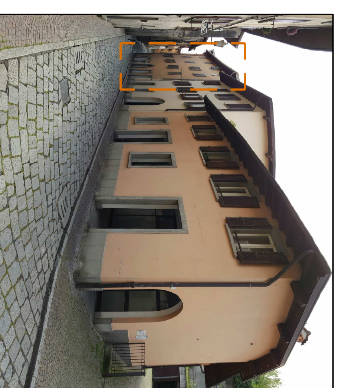
AREA OGGETTO DI INTERVENTO - BLOCCO A